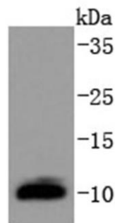
Fig. 1. Western blot analysis of DYNLL1 on MCF-7 cells lysates using anti-DYNLL1 antibody at 1/1,000 dilution.